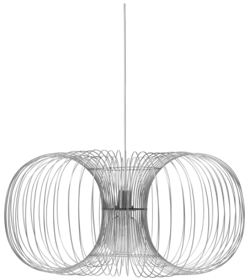
Coil Lamp Ø90 x H: 56,5 cm