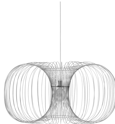
Coil Lamp Ø110 x H: 56,5 cm