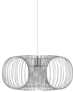
Coil Lamp Ø50 x H: 22,5 cm